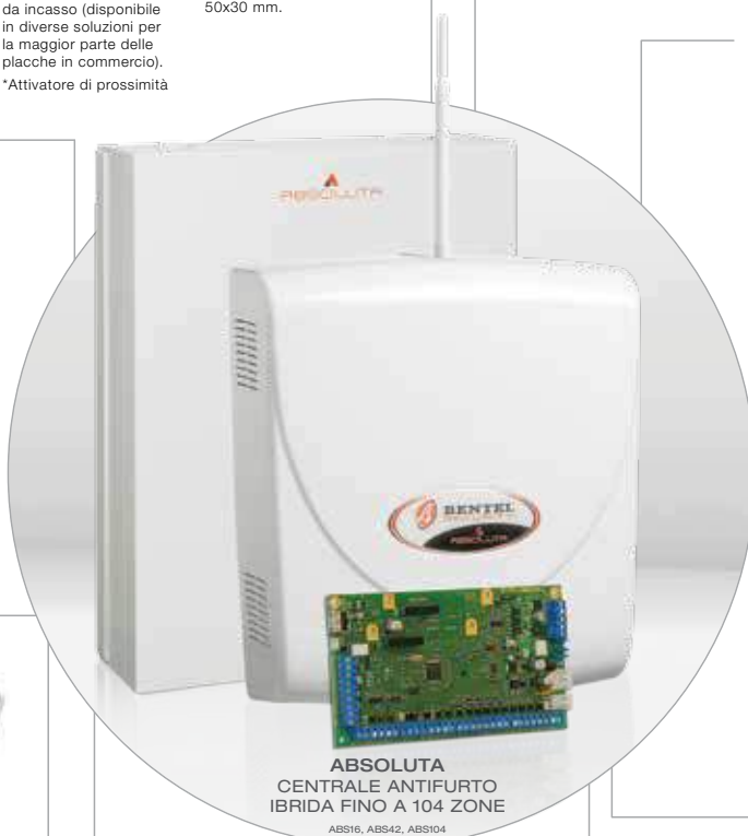
ABSOLUTA CENTRALE ANTIFURTO IBRIDA FINO A 104 ZONE ABS16, ABS42, ABS104

LADY Sirena autoalimentata per esterno con lampeggiatore; disponibile in versione antischiuma e con lampeggiatore strobo.