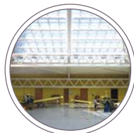
Magazzini e capannoni