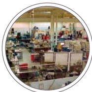
Siti industriali e Fabbriche