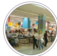
Centri commerciali, supermercati